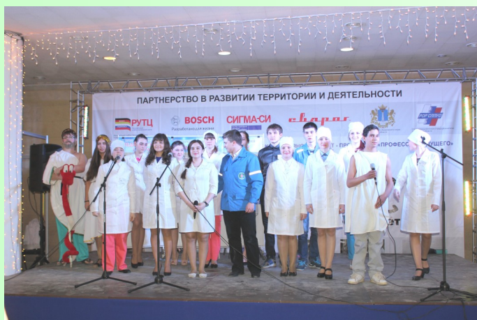
Выступление агитбригады «Будь здоров!»